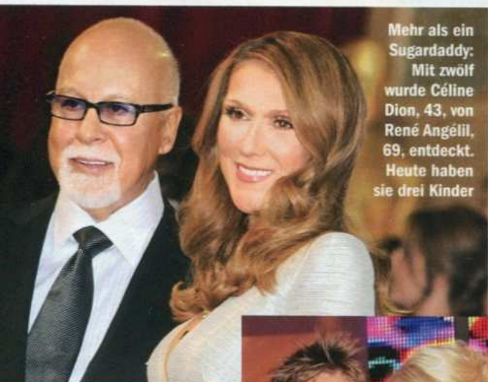
Mehr als ein Sugardaddy: Mit zwölf wurde Céline Dion, 43, von René Angélil, 69, entdeckt. Heute haben sie drei Kinder